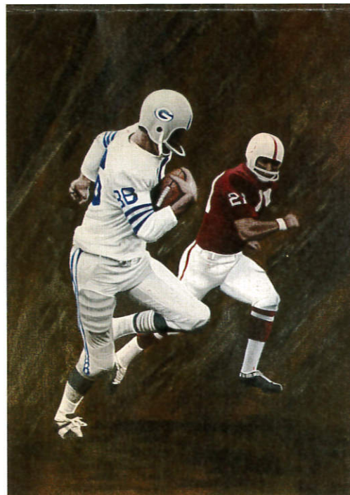
アメフト・イラストレーション