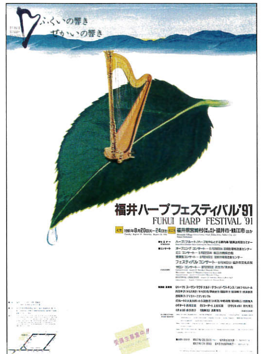
福井ハーブフェスティバル・ポスター