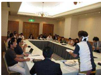
< 実行委員会 >