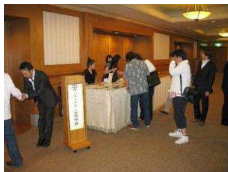
< 受付 >